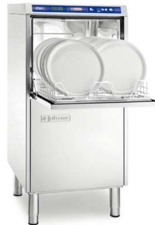
D 85 DGT