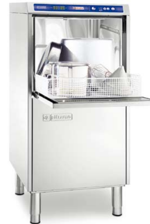
D 120 DGT