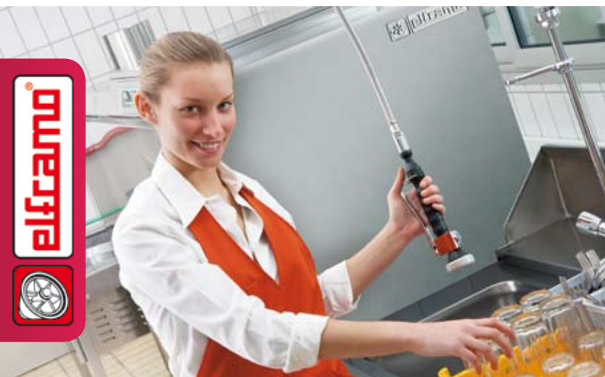
D 36/45/85/120 DGT

Isolamento termico su scocca e boiler.* Thermal insulation on chassis and boiler.* Châssis et surchauffeur avec isolation thermique.* Boiler und Karrosserie Wärme -und Lärmisoliert.*