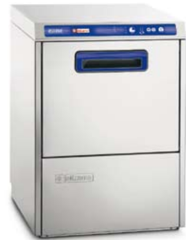
D 36 DGT